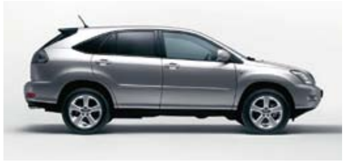
RX 350 är standardutrustad med takreling.