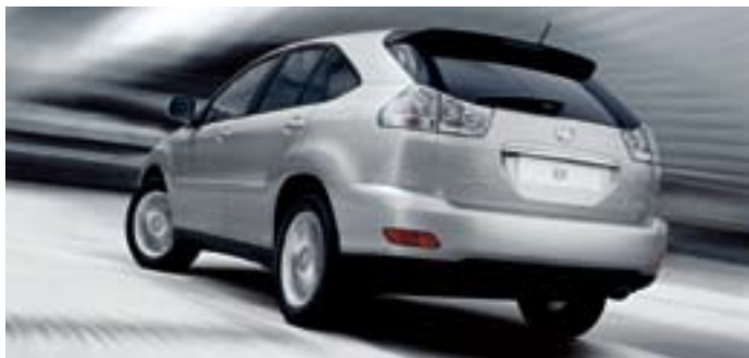
RX 350 är standardutrustad med takreling.