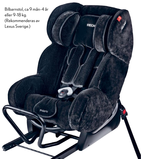
Bilbarnstol, ca 9 mån-4 år eller 9-18 kg. (Rekommenderas av Lexus Sverige.)