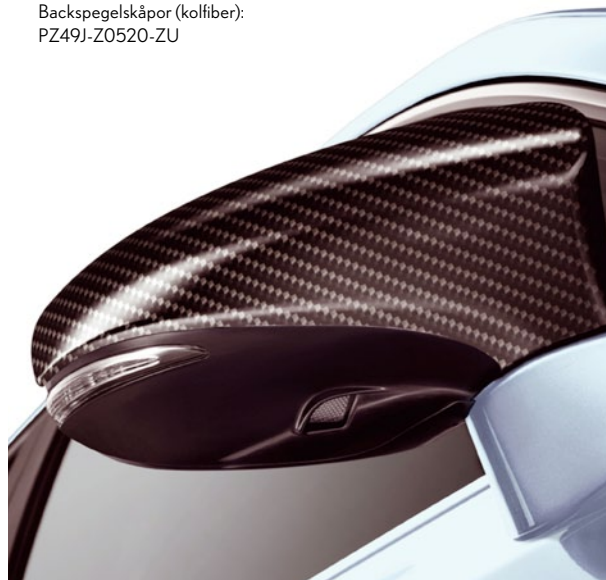
Backspegelskåpor (kolfiber): PZ49J-Z0520-ZU