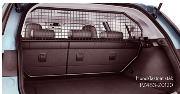
Hund/lastnät stål: PZ483-Z0120