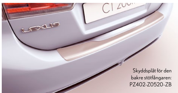
Skyddsplåt för den bakre stötfångaren: PZ402-Z0520-ZB