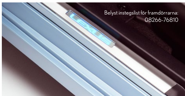
Belyst instegslist för främrdörrarna: 08266-76810