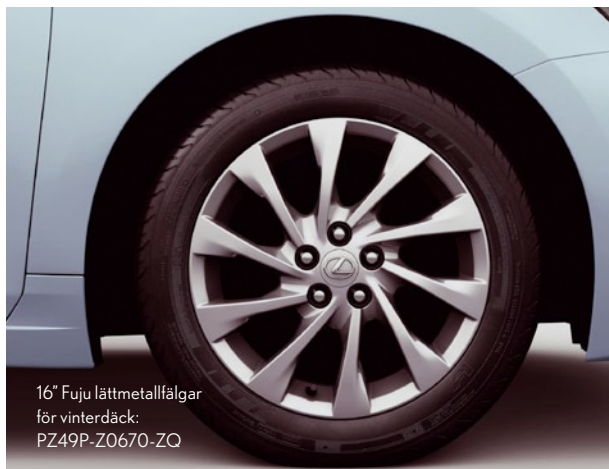
16" Fuji lättmetallfälgar för vinterdäck: PZ49P-Z0670-ZQ