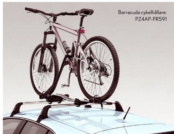
Barracuda cykelhållare: PZ4AP-PR591