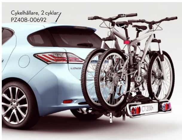
Cykelhållare, 2 cyklar: PZ408-00692