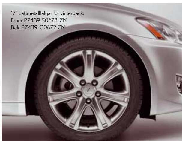
17" Lättmetallfälgar för vinterdäck: Fram: PZ439-S0673-ZM Bak: PZ439-C0672-ZM