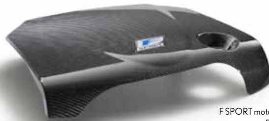
F SPORT motorkåpa kolfiber: PTR48-53080