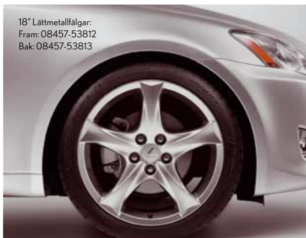
18" Lättmetallfälgar: Fram: 08457-53812 Bak: 08457-53813