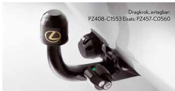
Dragkrok, avtagbar: PZ408-C1553 Elsats: PZ457-C0560