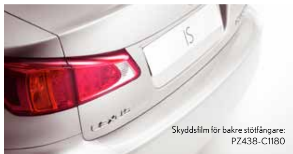
Skyddsfilm för bakre stötfångare: PZ438-C1180