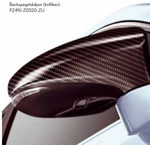
Backspegelskåpor (kolfiber): PZ49J-Z0520-ZU