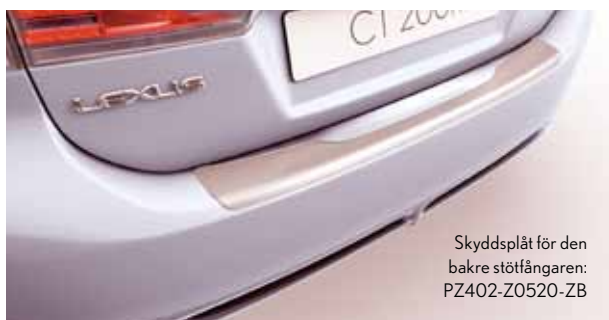
Skyddsplåt för den bakre stötfångaren: PZ402-Z0520-ZB