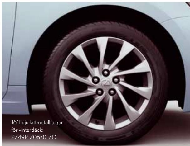
16" Fuji lättmetallfälgar för vinterdäck: PZ49P-Z0670-ZQ