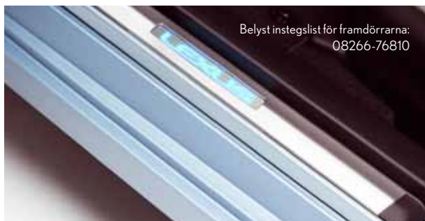
Belyst instegslist för främrdörrarna: 08266-76810